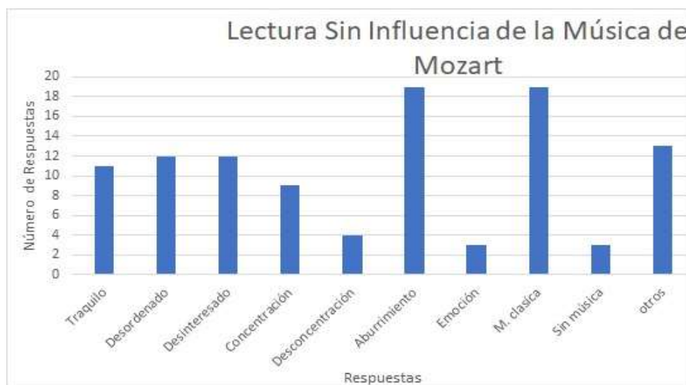
Figura 5. Lectura sin Influencia de la Música de Mozart

En la figura 5, se puede observar los resultados de los alumnos que leen sin la influencia de la música Mozart: