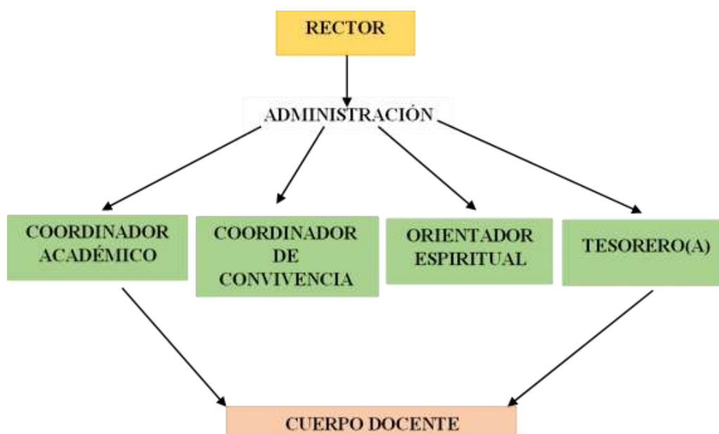
Figura 1. Organigrama Colegio Adventista Libertad

En la figura 1, se observa el organigrama del Colegio Adventista Libertad: