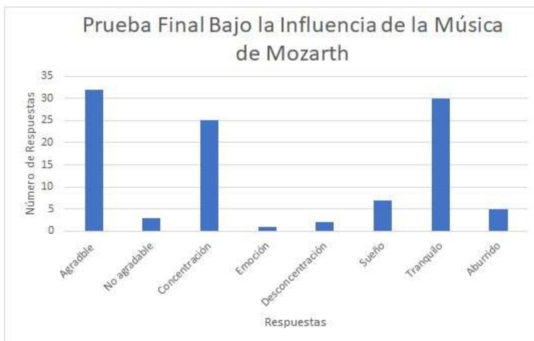
Figura 7. Prueba Final Bajo la influencia de la Música de Mozarth

En la figura 7, se puede observar los resultados de la prueba final que se le hizo a los alumnos bajo la influencia de la música Mozart: