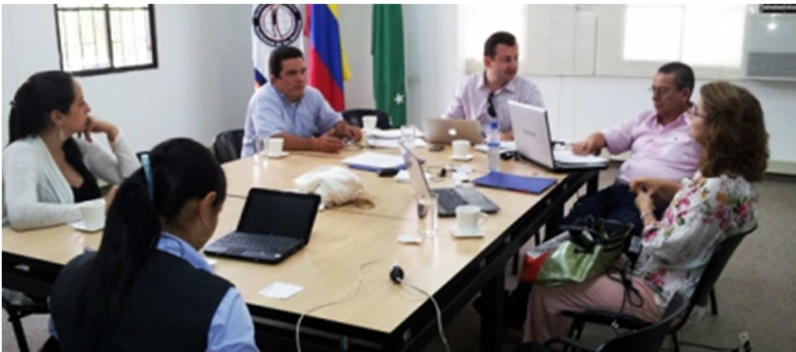
Fig. 8 Algunos de los fundadores ASUNAPH

En el año 2005 se crea la Asociación Universitaria Nacional de Atención Prehospitalaria ASUNAPH ( Fig. 8 ), conformada inicialmente por la Universidad Autónoma de Manizales, Corporación Universitaria Adventista, Universidad CES, Universidad Santiago de Cali y Universidad del Valle. ASUNAPH tiene como objetivo general, congregar a las Instituciones de educación superior de programas de Atención Prehospitalaria a nivel nacional, con el fin de establecer políticas académicas e implementar un proceso de trabajo sistemático, mancomunado y permanente que propenda por la calidad en la formación del Técnico Profesional y del Tecnólogo en Atención Prehospitalaria en el país ( Fig. 8 ).