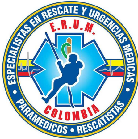
Fig.4 Fundación ERUM

En el año de 1999, luego de la graduación de la primera promoción de Técnicos en Emergencias Médicas dictada por el Cuerpo de Bomberos Voluntarios de Envigado, se extendió la invitación al público en general, especialmente a personas pertenecientes a grupos de socorro y afines. (Fig.5)