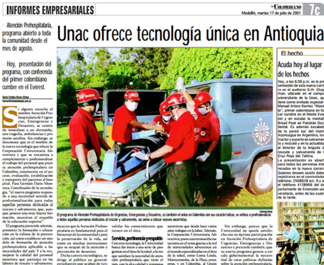
Fig. 7 Recorte de periódico local El Colombiano, UNAC ofrece tecnología única en Antioquia

En Agosto de 2001 inician las clases de la Tecnología en Atención Prehospitalaria de Urgencias, Emergencias y Desastres en la Corporación Universitaria Adventista. El hecho quedó registrado en el periódico local. (Fig. 7)