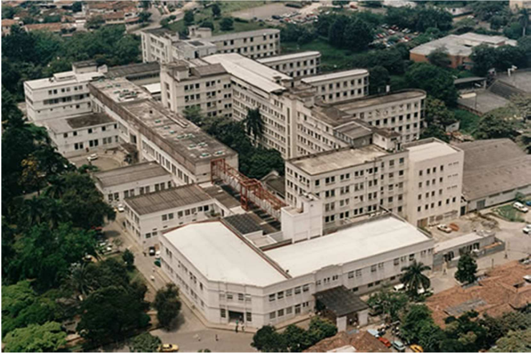
Fig. 2 Hospital Universitario del Valle