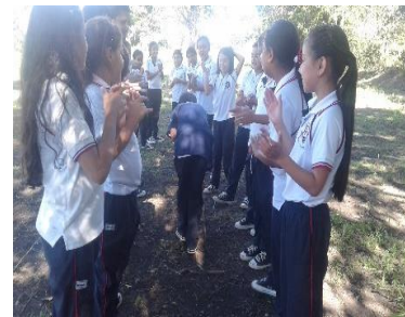
Pasillo de aplausos