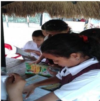
Cuentos con imágenes