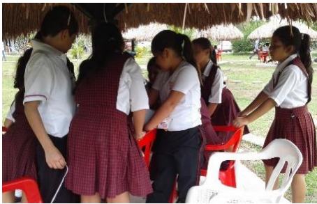
Fluidez Verbal, trabalenguas