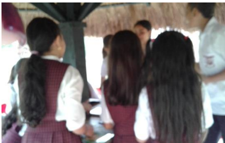
Lectura de labios