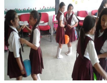
Hablando de sí mismo