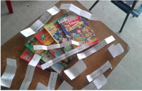
Material de la actividad