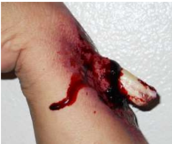
Ilustración 9 FRACTURA ABIERTA