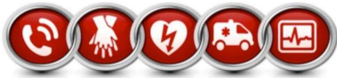
Ilustración 14 CADENA DE SUPERVIVENCIA Y DEA

( https://image.slidesharecdn.com/svbcondea-150516180143-lva1-app6891/95/svb-con-dea-11-638.jpg?cb=1431799544 )