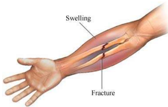
Ilustración 10 FRACTURACERRADA

( http://services.epnet.com/getimage.aspx?imageid=7310 )