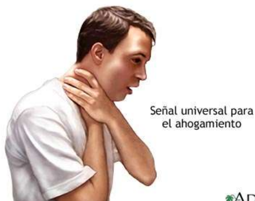
Ilustración 11 EMERGENCIA RESPIRATORIA