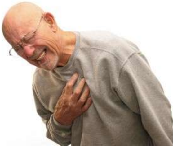
Ilustración 12 EMERGENCIACARDIACA

( http://world.edu/wp-content/uploads/2017/08/Mesothelioma-Symptoms.jpg )