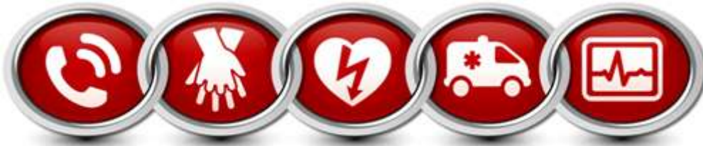
Ilustración 13 CADENA DE SUPERVIVENCIA

https://webapps.arlingtontx.gov/tmp/fire/CPaRlington/images/CPaRlington_chainofsurvival.jpg