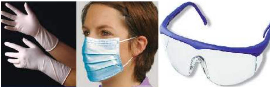
Ilustración 1 BIOSEGURIDAD

( http://files.auxilar-en-enfermeria-c-1-esaf.webnode.es/200000034-660ce68003/barreas%20fisi.png )