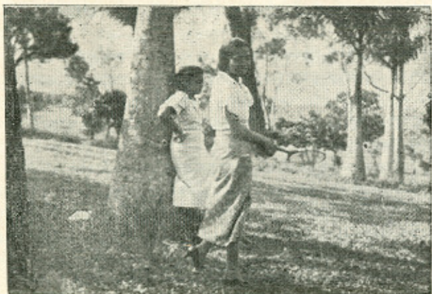
RATOS DE DIVERSION