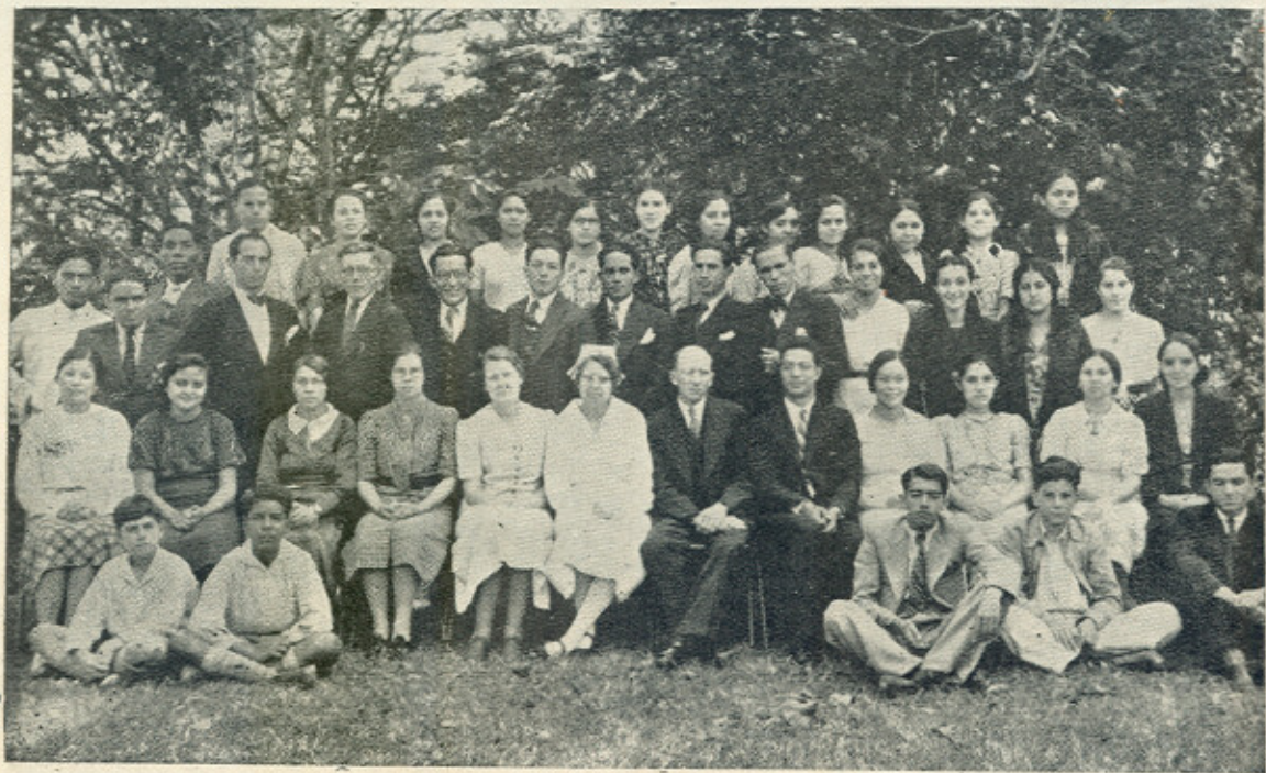
CUERPO ESTUDIANTIL Y PERSONAL DOCENTE