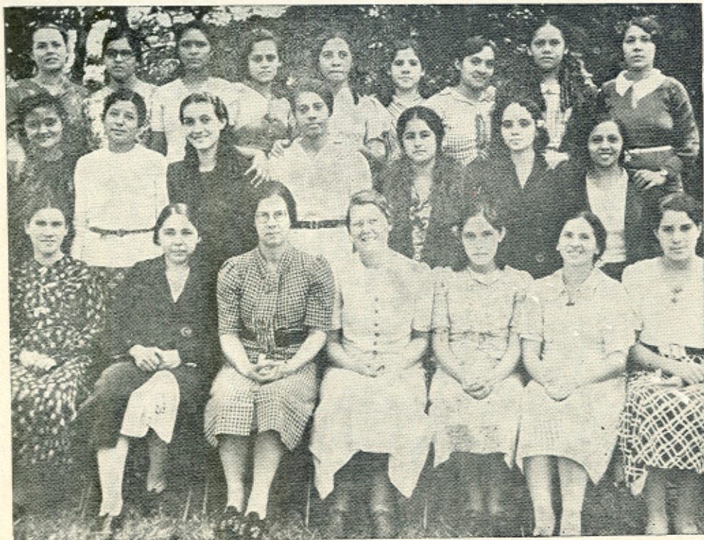
LAS SEÑORITAS CON SU PRECEPTORA