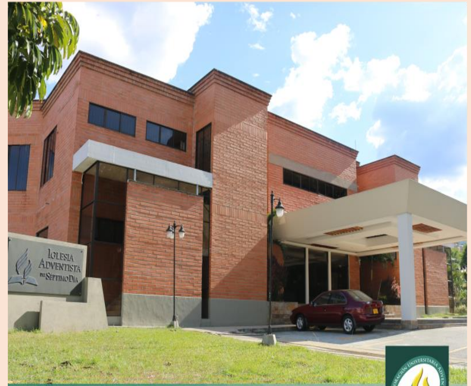
Iglesia Universitaria UNAC