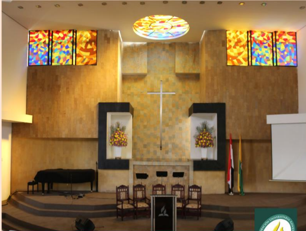
Iglesia Universitaria UNAC

DESPUÉS DE ARDUOS ESFUERZOS EL TEMPLO QUEDO TERMINADO PARA LA HONRA Y GLORIA DE DIOS