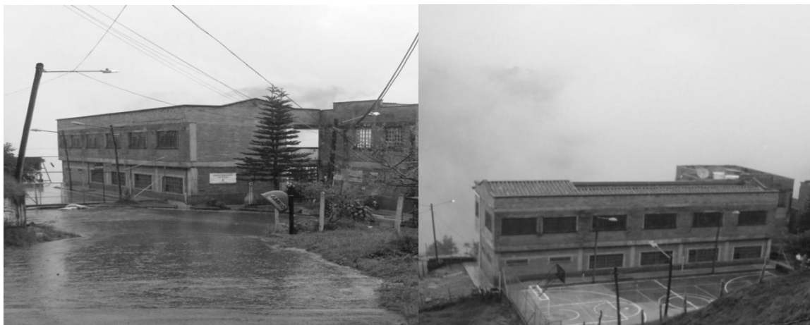
Grafica 2 imagen del C.E. La Aldea Sección La Suiza

Centro Educativo La Aldea, Sección La Suiza, Vereda La Suiza, San Sebastián de Palmitas.