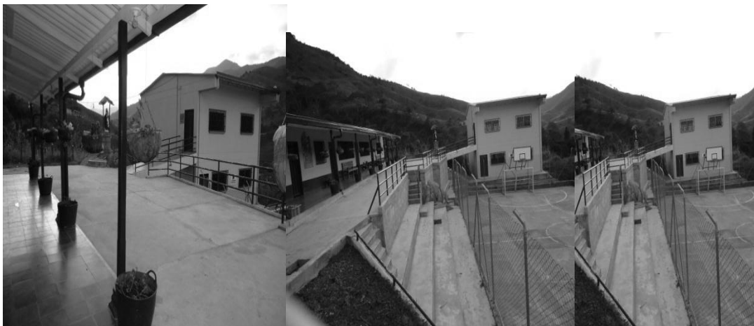
Grafica 3 Centro Educativo Rural Pandeazúcar, municipio de Donmatías