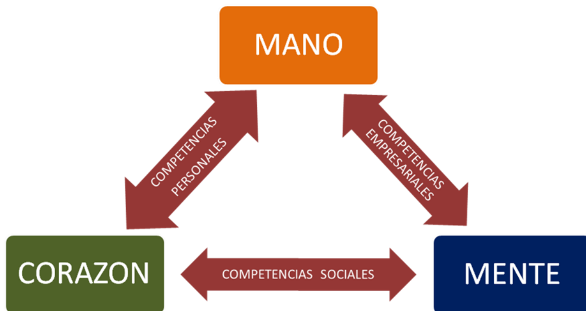
Grafica 1. Filosofía adventista versus emprendimiento

Al referirse a: Amado, yo deseo que tú seas prosperado en todas las cosas, y que tengas salud, así como prospera tu alma” (3ª de Juan 2)