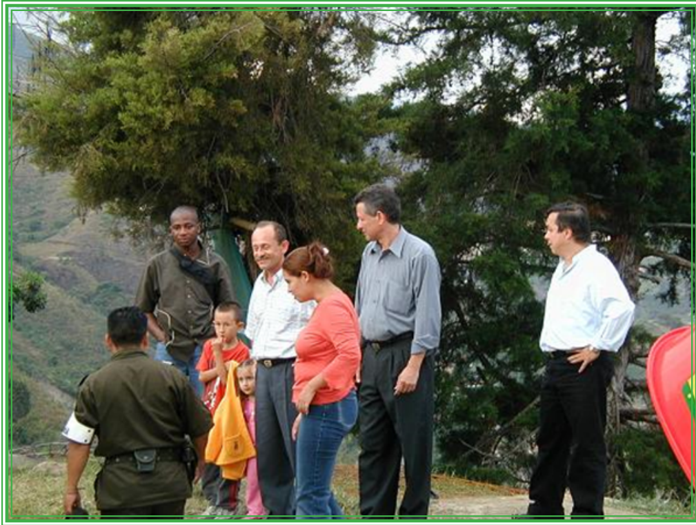
Visitantes de UNAC en la Comuna 13, una semana después de la retoma.