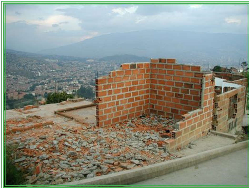
Casa destruida en la Comuna 13, en octubre de 2002.