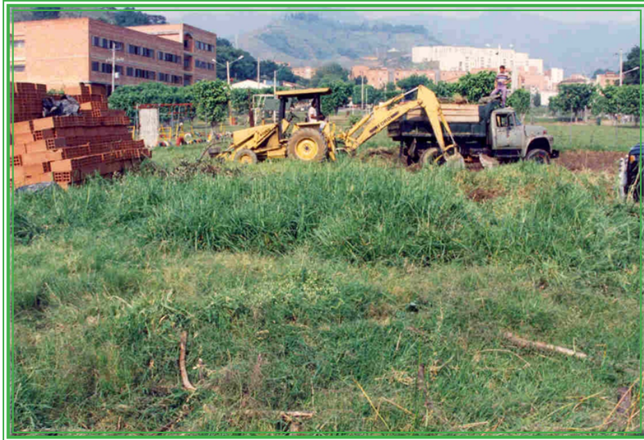
Remoción de tierra al norte de la propiedad, para construir el templo, en 1996.