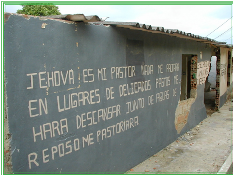
Lugar de cultos de una confesión evangélica, en la Comuna 13, en octubre de 2002.