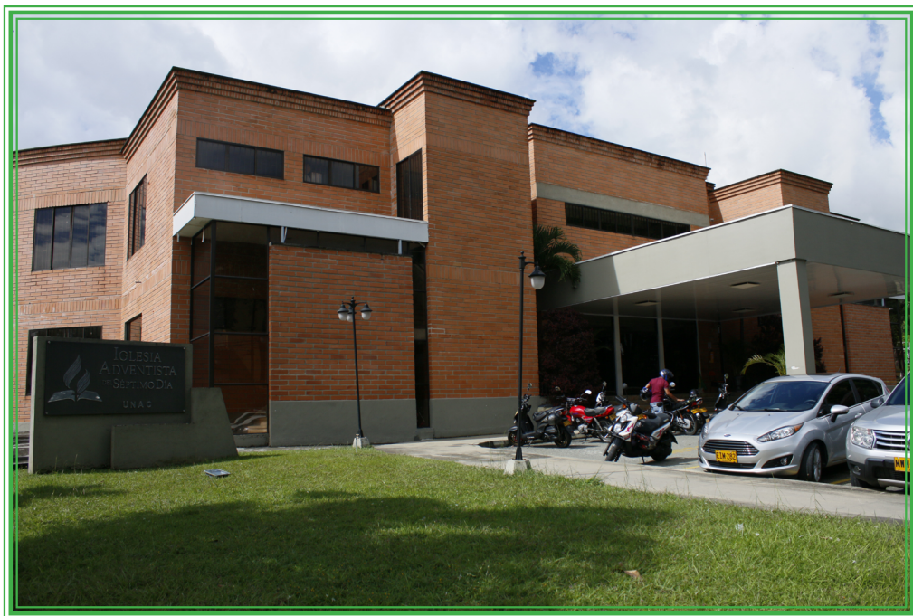
Foto de templo en 2017