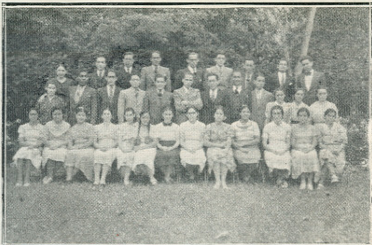
LOS ESTUDIANTES QUE GANARON BECAS