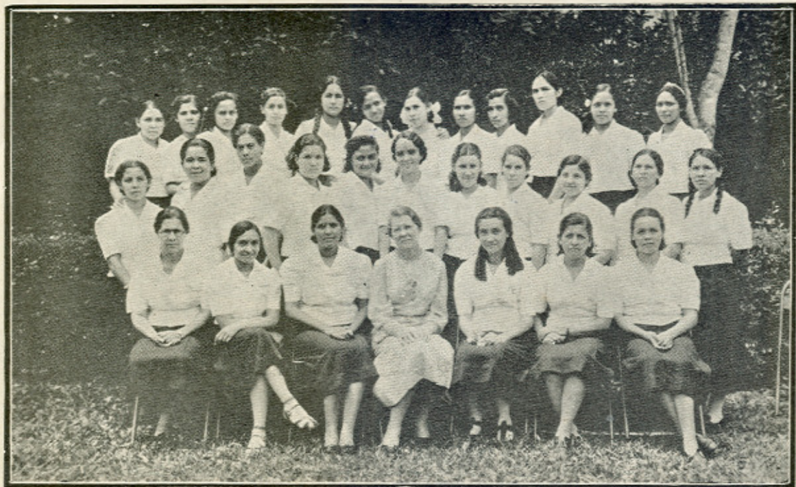
LAS SEÑORITAS CON SU PRECEPTORA