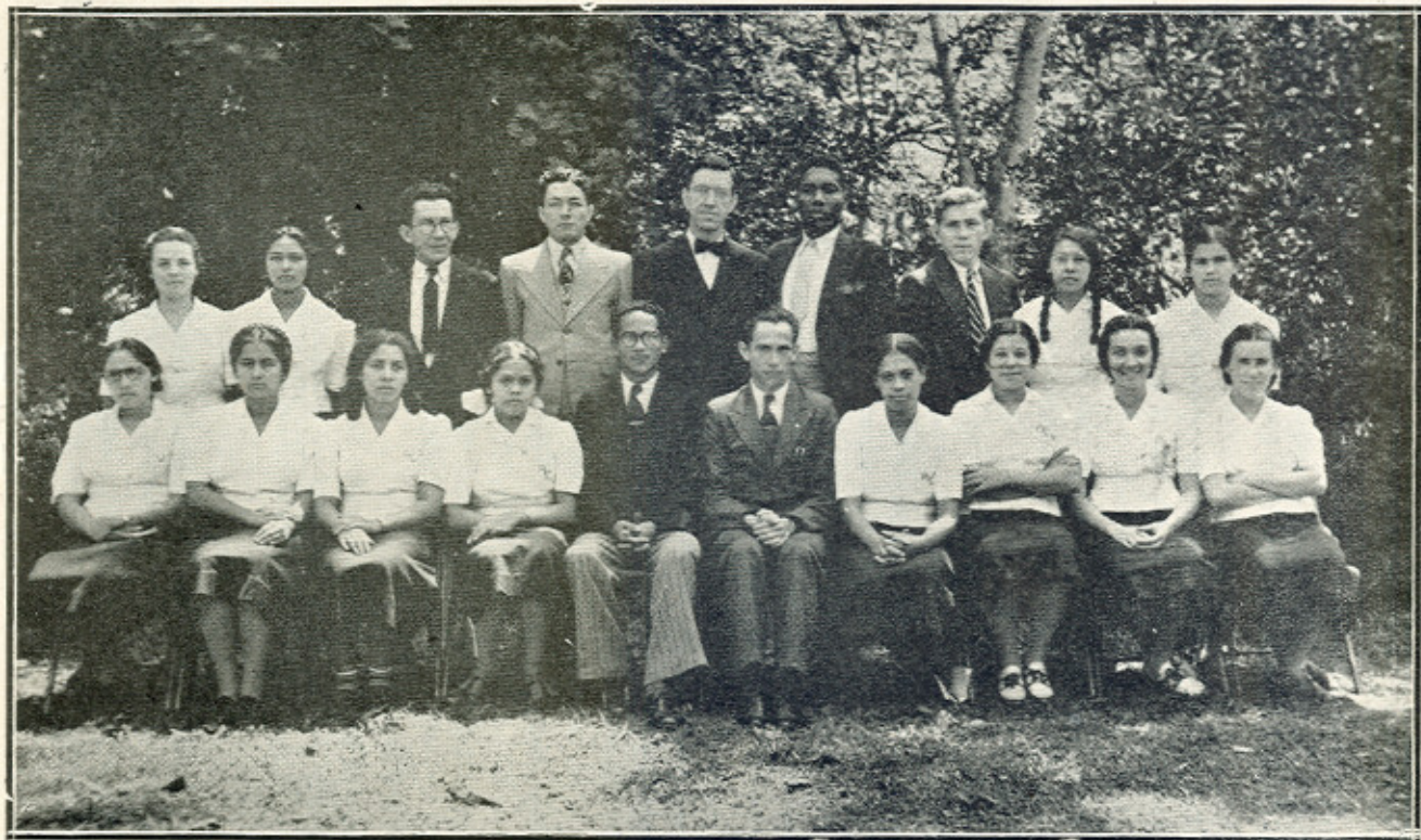
LOS GRADUADOS DEL CURSO PREPARATORIO