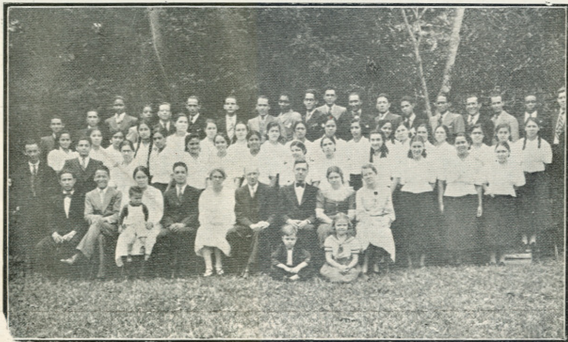
CUERPO ESTUDIANTIL Y PERSONAL DOCENTE