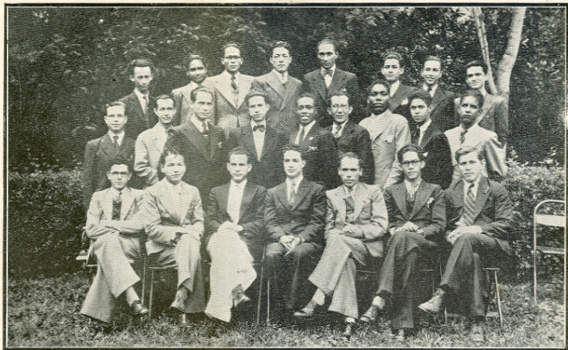
LOS JOVENES CON SU PRECEPTOR