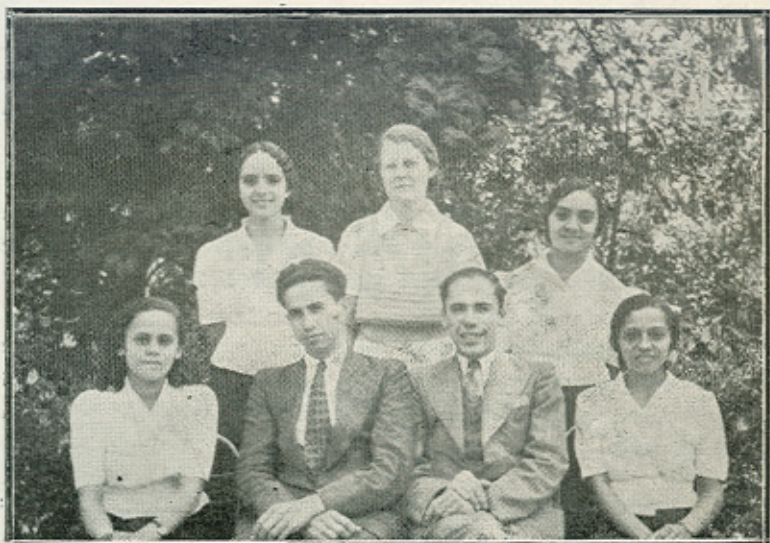
LOS PRE-GRADUADOS DEL CURSO SECUNDARIO