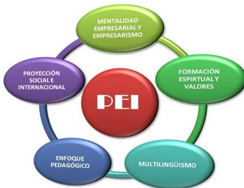
Gráfico 2: PEI del Colegio Canadiense

Los ejes fundamentales del Proyecto Educativo Institucional se evidencian en el siguiente esquema, donde cada de los ejes se relaciona de manera dinámica, coherente, permanente y armónica