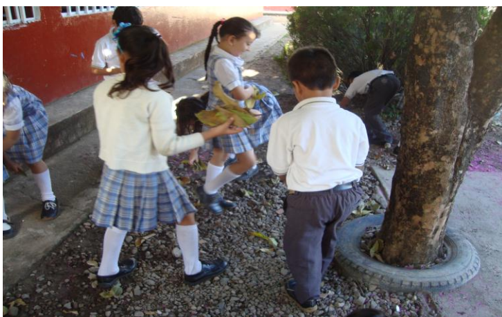
Estudiantes realizando jornada de embellecer un lugar del colegio. Actividad Taller 5 Perseverancia y Laboriosidad.