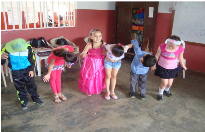
Finalización de la actividad Taller 3