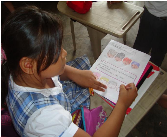
Estudiantes desarrollando el Taller 6 Tolerancia y Generosidad de la cartilla de Niños.