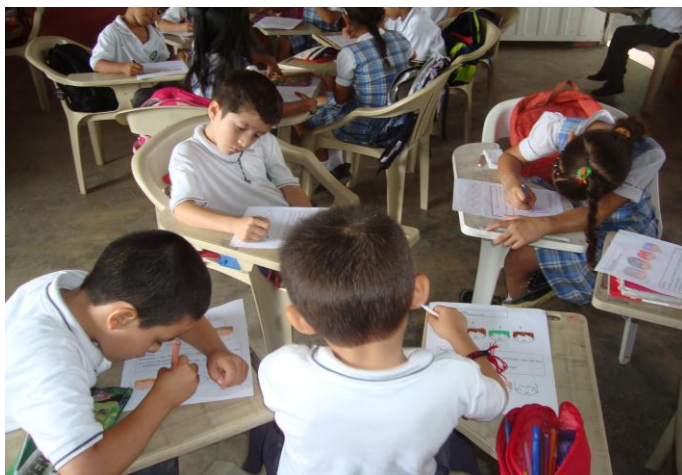
Trabajo en grupo Taller 6 Tolerancia y Generosidad. Disfrutaban al realizar el trabajo en grupo; pues podían compartir y expresar a sus compañeros los sentimientos que genera la actividad.