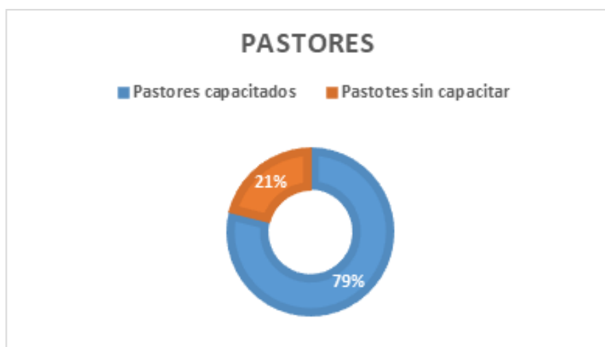
Gráfico 2. Capacitación pastores

De los 38 pastores que se encuentran vinculados a la Asociación, el 79% equivalente a 30 pastores, han recibido la socialización de la guía implementada sobre la preparación de la información exógena e información tributaria.