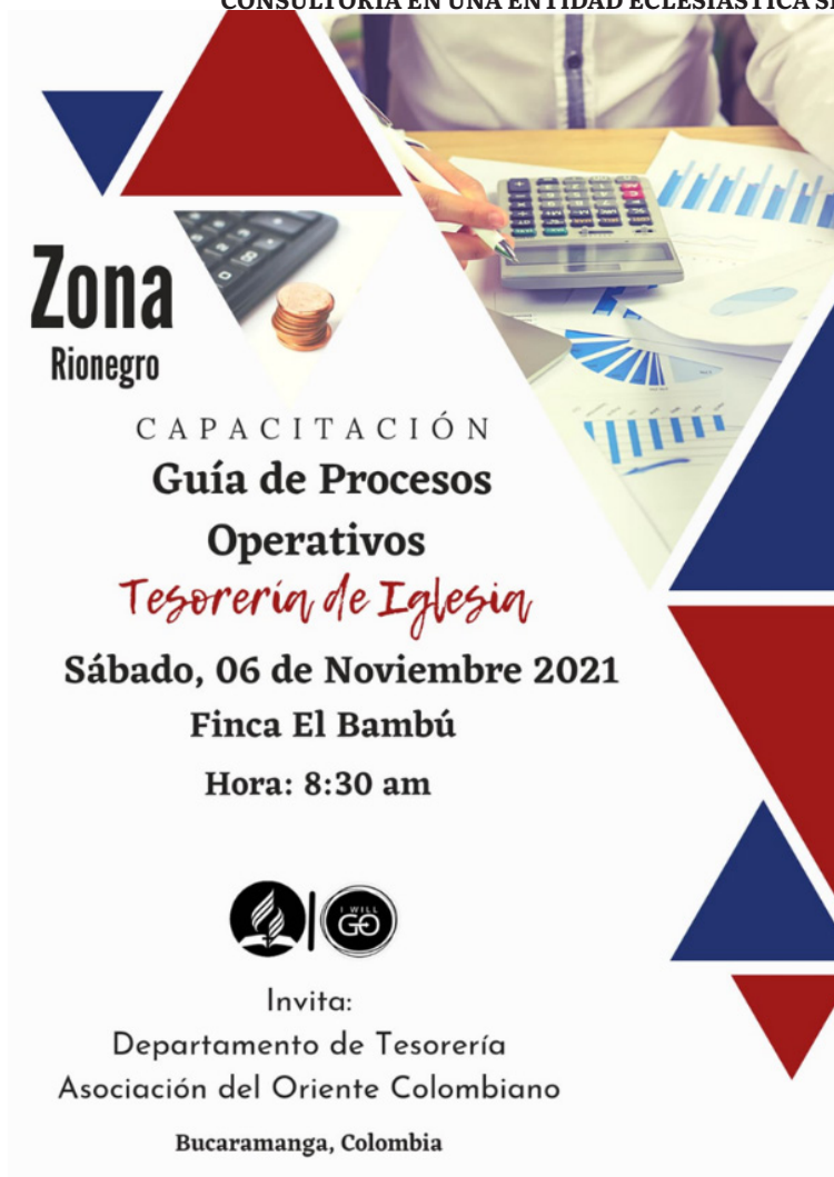
Imagen 1. Publicidad de capacitación on Guía de procesos operativos