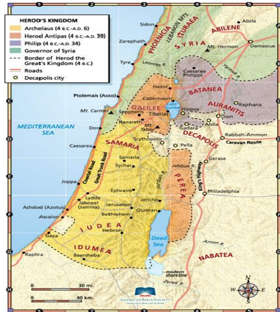
Mapa político donde gobernó Arquelao

Roma y pidiera para él ese título. Antipas, en contra de lo que le dictaba la razón, viajó el año 39 d. C.; pero entre tanto Agripa informaba a Calígula que Antipas había transgredido los reglamentos imperiales al acumular una gran cantidad de armamentos. Cuando Antipas llegó a Roma, el emperador lo obligó a que reconociera la verdad de esa acusación, y fue inmediatamente desterrado junto con su esposa a Lyon, en las Galias. Calígula añadió entonces los territorios de Galilea y Perea a los dominios de Herodes Agripa I 3 .